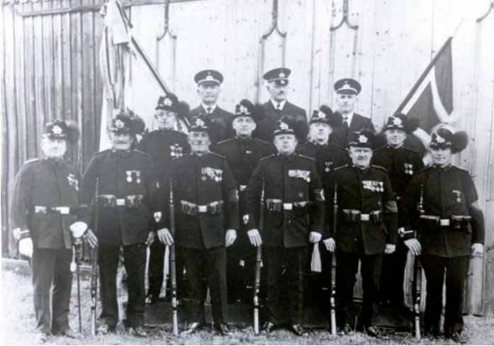
Die Kriegerkameradschaft Rothenkirchen mit der Gewehrabteilung 1936 am ehemaligen Schuberts-Gut

1892 fand die Weihe des vereinigten Krieger- und Wettindenkmals an der im Jahre 1889 gepflanzten "Wettin-Eiche" statt. Auf einer großen Marmortafel als Zeichen der Dankbarkeit den Streitern des Ortes im Kriege 1870/71, besonders dem bei Sedan (Frankreich) gefallenen Jäger Christian Lorenz gewidmet war. Der Sedantag (Sieg gegen Frankreich und Gefangennahme von Kaiser Napoleon) wurde immer festlich im Ort begangen als Schulfest, verbunden mit Belustigungen, Festessen, Verteilung von Buchprämien und Preisen bei den Wettkämpfen. Das Krieger-Denkmal wurde auf Beschluss des Gemeinderates am 5. Januar 1937, gemeinsam mit dem alten Feuerlöschgeräthaus zur Neuerrichtung und Verschönerung des Platzes abgetragen. Hier entstand der Weihnachtsbaum für Alle.