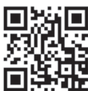
Merkblätter zur Wiesenanlage und -pflege