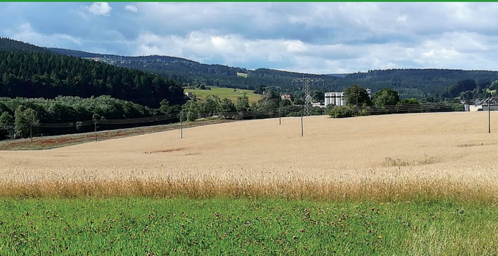
BLICK AUF DIE WERNESGRÜNER BRAUEREI