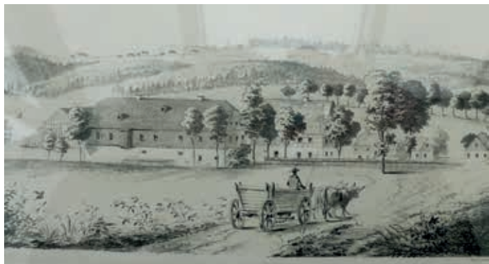
Bild: Das Rittergutsgehöft in Rothenkirchen