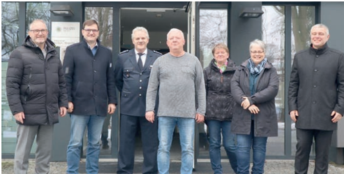
Verabschiedung im Polizeirevier Auerbach am 31. Januar 2023