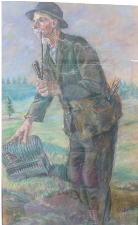
Der Vogelsteller mit seiner Ausrüstung

Was das für die Vögel für eine Umstellung braucht, wenn sie ihre goldene Freiheit gegen den Vogelbauer eintauschen müssen. Das sie sich aber besser und schneller daran gewöhnen sollen, kriegen sie die ersten paar Tage ein schwarzes Tuch über den Bauer gehängt. Sonst würden die armen Viecher sich darin zu tote rammeln. Oskar baut sich seine Vogelhäuschen alle zusammen selbst. Da hat er sich draußen im Schuppen so eine richtige kleine Werkstatt eingerichtet. In dem Schuppen wird auch der Leim gekocht, der danach für die Ruten zum Aufziehen gebraucht wird. Hinten in der kleinen Ecke steht ein großer Tontopf mit Mehlwürmern, die bekommen die Rotkehlchen zum Fressen.